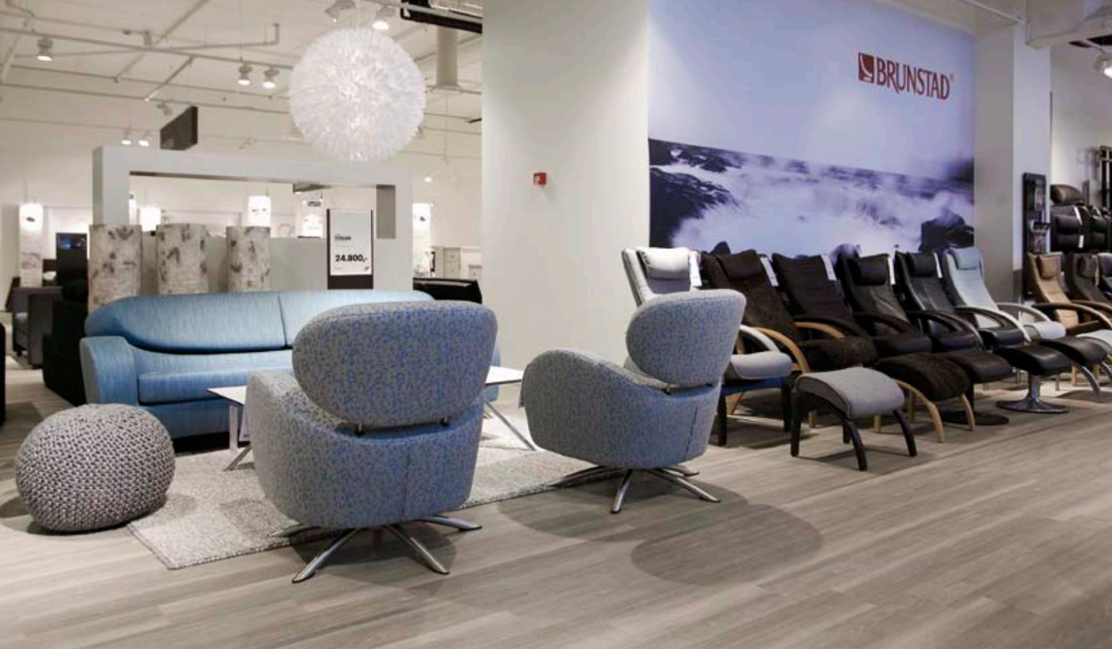
GREY. Ash Grey 6164 fra gulvkolleksjonen Expona Design i nye Bohus Strømmen Storsenter.