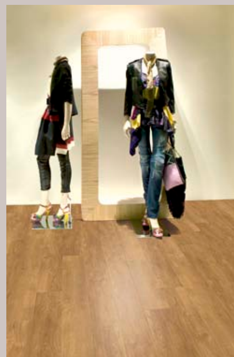
SIMPLAY. American Oak.

Kolleksjonen har tilsvarende naturmønstre som Mineral fx, men den har noen tremønstre i tillegg. Også denne gir en trinnlydsforbedring på 19dB. Tykkelsen er 3,5 mm.