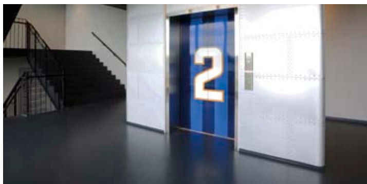
GUMMIGULV. Artigo Ardesia. Heisrommene har materiale som en flykropp.