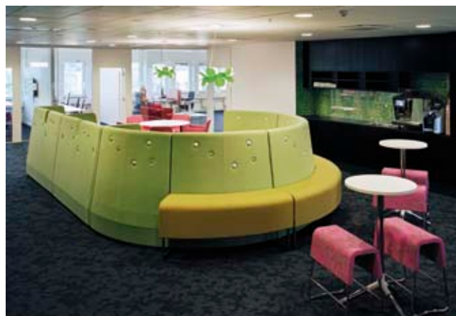
ABBOTT PHARMACEUTICALS i Stockholm med Vorwerk-tepper Contura leaves 9b63 .

TexTiles. Hele vårt flisprogram går under fellesnavnet Textiles. Den inneholder ikke minst de innovative seriene Scale og Freescale, kretet av designeren Hadi Teherani – i forskjellige størrelser, kvaliteter og fargegrupperinger. Spesielt spennende er kolleksjonen Freescale som er teppefliser i ikke-kvadratiske former. Her finner vi tre forskjellige nye for-