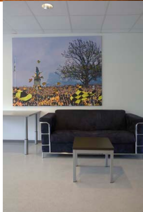
STARTS LOKALER. Polyflor Classic Mystique.

Håndverker gulv: MJA Maler og Gulvbelegg AS, Kristiansand